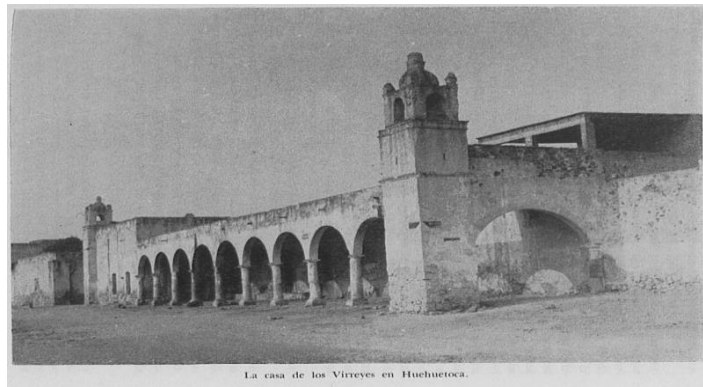
La casa de los Virreyes en Huehuetoca.

La falta de mantenimiento del inmueble, contribuyó a que con el pasar de los años, la casa de los virreyes perdiera gran parte de su patrimonio histórico.